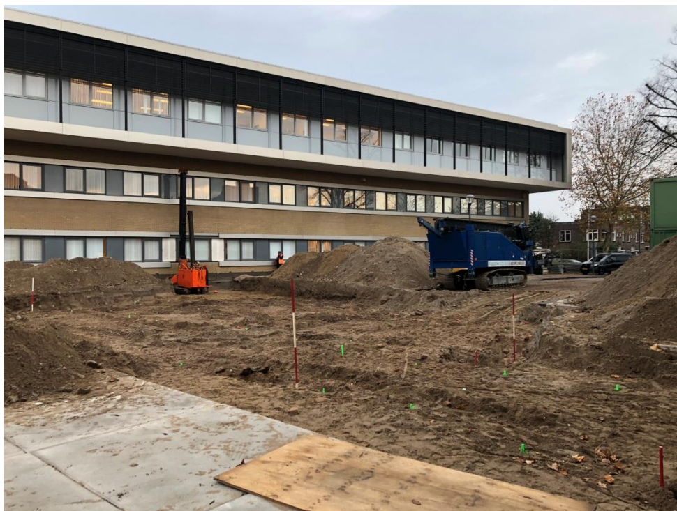
Bouw corridor gestart

De verhuizing loopt helaas enige vertraging op. Dit komt door wat tegenvallers in de bouw. Zo is de corridor, de overdekte verbinding tussen het Gezondheidshuis en het Diaconessenhuis, pas in de loop van het voorjaar klaar. We kunnen pas verhuizen als we die doorgang kunnen gebruiken. Het vooruitzicht is nu dat het nieuwe centrum in het eerste kwartaal van 2019 klaar is.